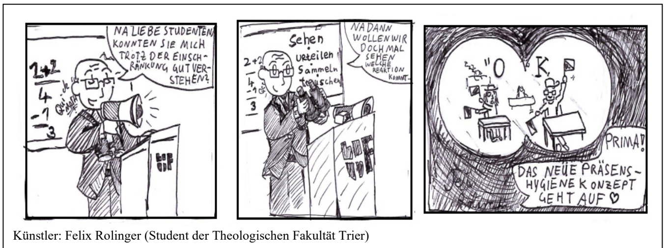
Künstler: Felix Rolinger (Student der Theologischen Fakultät Trier)